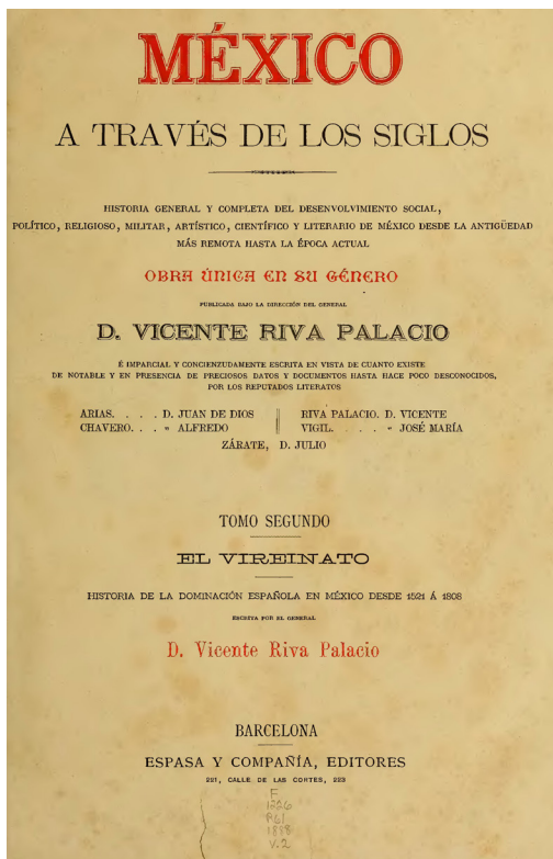
Tomo II de México a través de los siglos.

Fue hijo del licenciado Mariano Rivapalacio Díaz y de Dolores Guerrero, hija de Vicente Guerrero Saldaña. Escribió comedias, poesía, crítica política y literatura. Entre sus obras, destacan: Calvario y tambor; Monja, casada y virgen; Martín Garatuza y Mártir. Murió en España cuando se desempeñaba como embajador plenipotenciario en el gobierno de Porfirio Díaz Mori.