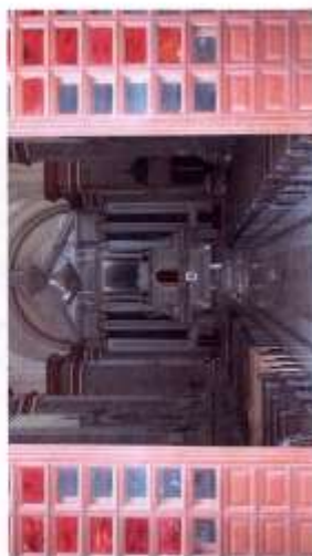
Retablo del Templo de San Antonio de Padua