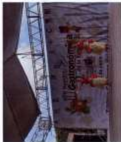
Muestras gastronómicas regionales