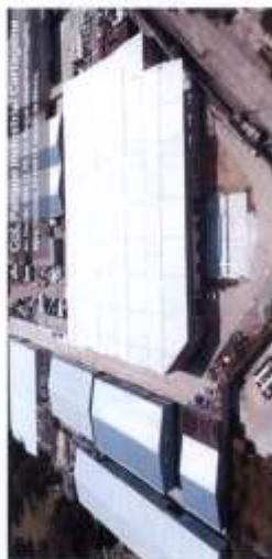
Parque industrial Cartagena