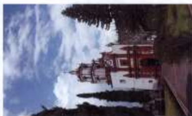
Templo de San Pablo de las Salinas