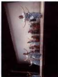
Festival Internacional de Danza