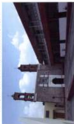
Templo del Barrio de la Concepción