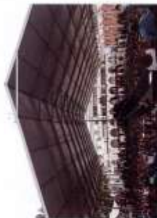
Festival Anual de San Antonio