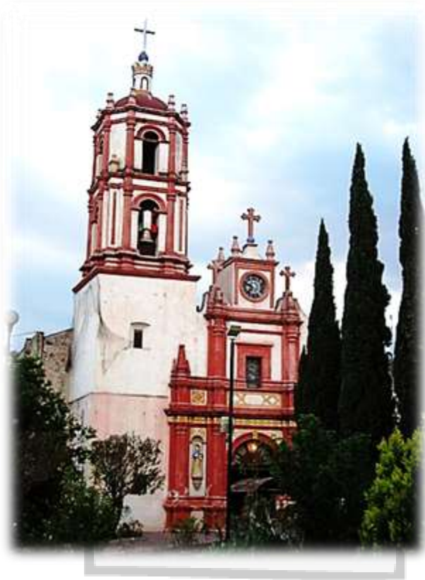
“Parroquia San Pedro y San Pablo, Avenida San Pablo y Ortiz de Domínguez S/N. San Pablo de las Salinas, Tultitlán”