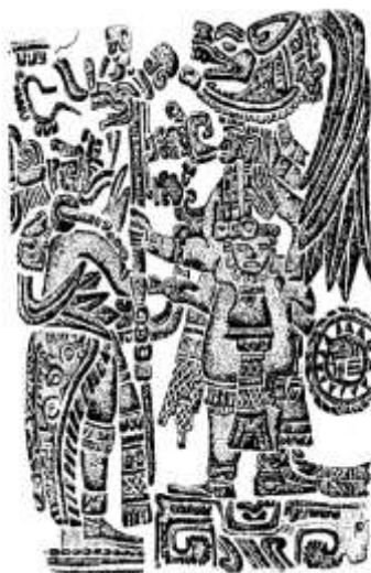
Molde de barro con representación de dos sacerdotes toltecas, procedente de Tultitlán según Von Witzling.

“TULTITLÁN En el Tiempo” Autor: Luis Cordoba Barradas