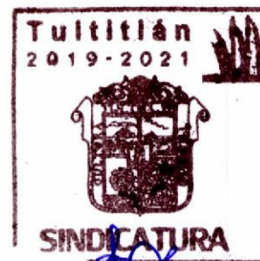
C. Andrés Sosa Ménera Síndico Municipal de Tultitlán, México